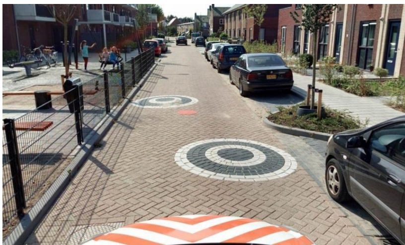
Mini punaises Een cirkelvormige verkeersdrempel