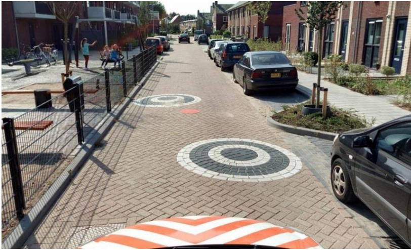
Mini punaises Een cirkelvormige verkeersdrempel